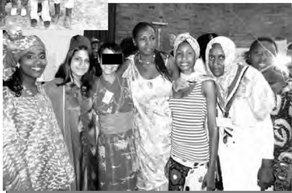
※アドボカシー（提唱活動）

私達が人々の暮らしを良くするために「自分たちで学び」「メッセージを伝え」「実践し」、社会に影響を与えること