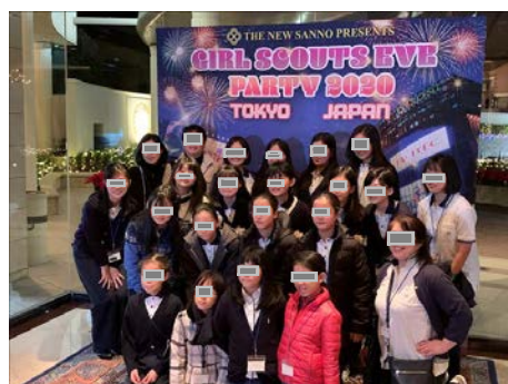
GIRL SCOUTS EVE PARTY 2020 @新山王ホテル

これ以降、急なコロナウイルスの影響で集会は連休明け迄全て中止。リーダーはメール等を通しスカウトとの連絡をしています。