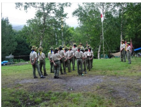
港16団との合同夏キャンプ @群馬県みなかみ町 「宝台樹キャンプ場」

本年は大きな問題、怪我もなく全員元気にこの1年間無事に活動を終えることが出来たことを感謝しています。また、米国で24WSJを開催したが、その後、米国ボーイスカウト内部で蓄積していた問題が表面化し訴訟となり、BS米国連盟は破産申請をしました。多くのキャンプ場（24WSJ開催地含む）などの資産を売却し、補償費（10億ドル）を捻出すると新聞に掲載された。大きな問題です。日本連盟は数年前よりリーダー・団運営関連者に「セーフ・フロム・ハーム」のプログラムを採用し、勉強会を実施しています。このプログラムはスカウト達の安全を確保できる政策や施策で、人権を尊重し危険や危害をなくす取組です。指導者とスカウト間の活動中にモラルを守り、スカウト達が安心して活動できるようにするプログラムです。米国のような事件が起きないよう日本連盟から強く指導を受けています。