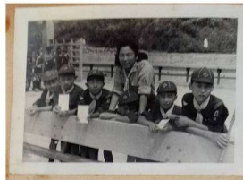
(カブ：秩父のユースホステル)