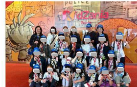
ブラウニー 春行事 キッズニア

また、ミッドタウンでの緑の募金活動では、自分の行動が社会や世界の役に立っていることを感じて、とてもうれしくなりました。募金をしてくれた方々へのありがとうの気持ちをわすれずにいたい。冬のクリスマスページェントでは、役をえんじること、イエス様が生まれた時のお話を知ることができました。ブラウニーの仲間と一緒にげきをやりとげた時、みんなへのかんしゃの気持ちでいっぱいになり、私も困っている人のために役に立ちたいと強く思いました。いろいろな活動を通して、霊南坂教会についても学ぶことができました。教会は、いろいろな人の心が休まる場所であり、大切なところなんだと分かりました。去年の夏休みに椿先生からお話をうかがった時、教会の活動はたくさんの人の「だれかの役に立ちたい」というやさしい気持ちや、だれかのために一生けんめいつくす心で支えられていることを知りました。それはとてもありがたいことだと思い、心にのこりました。同時に、いつも私たちのめんどろを見てくれるリーダーの方々のことを思い、自分たちスカウトの活動がどれだけ多くの人たちに支えられているのかに気づきました。四月からのジュニア部門では、もっと人を助けることができる自分になりたいです。たくさんの人の笑顔が見たいです。そのために、いろいろなことを学び、じゅんぴをしていこうと思います。私の通っている学校には「世の光となろう」という教えがあります。いつか、自分の仕事を通してだれかに喜んでもらえるような大人になれるよう、一生けんめい取り組みたいです。そして、とくいな英語を生かして、いつか外国のスカウトたちとも仲良くなり、世界中にたくさんの笑顔を広げていきたいです。ジュニアでの新しい活動がいまから楽しみです。