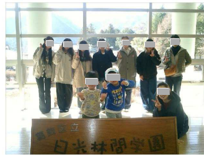
レンジャー 春キャンプ 日光・鬼怒川

12年間のスカウト活動を通して得たものは数え切れませんが、何よりの宝物はそんな仲間との出会いだと考えています。これからもこの経験と仲間を大切に、リーダーとしてスカウトたちと共に成長し、ロールモデルとなれる存在になりたいです。