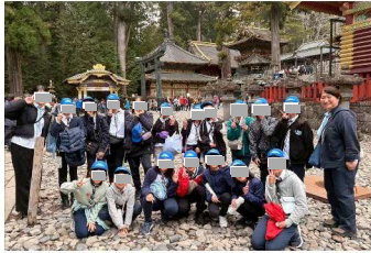
ジュニア 春キャンプ 日光東照宮

たけれど、友だちと声をかけ合いながらすごしました。カヌーに乗ったり、みんなで食べたソフトクリームはとてもおいしくて、今でもわすれられません。春キャンプでは、ブラウニーのときに劇団四季を見に行き、ジュニアでは日光へ行きました。どちらもふだんできない体験で、とても楽しかったです。こんど、引っこしでみんなとおわかれすることになり、とてもさびしいです。でも、ガールスカウトで学んだことや楽しかった思い出を大切に、新しい場所でもがんばりたいと思います。