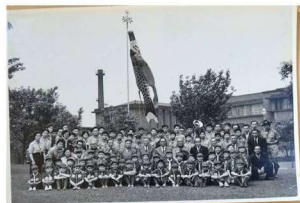
(BS：首相官邸訪問：池田首相)