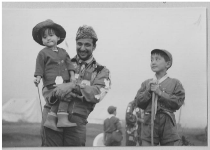
（写真2：アジアジャンボリー）

はじめに、私が霊南坂教会スカウトであった短い歴史を書かせていただきます。1962年7月、2歳10ヶ月の私は7つ年上の兄が参加したカブスカウトキャンプ（伊東）に同行。この写真は翌月の8月3日から8日まで、静岡県御殿場市で開催された第3回日本ジャンボリーにも行った時のもので、昔から私のお気に入りです。〔写真2〕