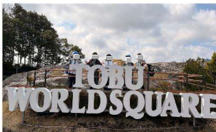
シニア 春キャンプ 東武ワールドスクエア

まだまだ至らない点もありますが、今年度からは不足している部分を自ら吸収していくとともに、自分にできることを考え、より主体的に行動していきたいです。その結果、スカウトにとって1つの居場所となり、スカウト活動の魅力を感じてもらえるような集会やキャンプを企画していきます。