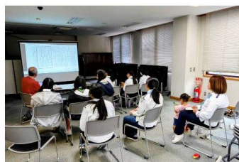
(2026/03/07：昔のスカウト活動についての説明)